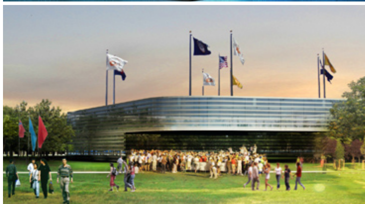
Rappresentazioni indicative dei progetti per l'Expo 2015

VOUOI CONTRIBUIRE AL PROSSIMO NUMERO DEL FOGLIO DI BUCCINASCO? Manda una mail a ilfoglio@buccinasco.net AGGIORNAMENTI E APPROFONDIMENTI SU www.buccinasco.net